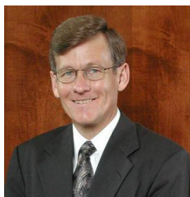
Рой Гэйн, профессор кафедры Ветхого Завета и древних ближневосточных языков, Духовная семинария университета им. Эндрюса

Мы видим, что законы против гомосексуальной практики в Лев. 18:22 и 20:13 появляются в контексте, содержащем нравственные законы, которые ведут Божий народ к нравственной чистоте и освященной жизни, что указывает на то, что данные законы вечны. Новый Завет подтверждает применимость священных законов книги Левит и для сегодняшнего дня. Иерусалимский совет выработал требования к образу жизни для христиан из язычников: «воздерживаться от идоложертвенного и крови, и удавленины, и блуда» (Деян. 15:29; ср. ст. 20). Перечень в данном стихе подытоживает группы запретов в Лев. 17 и 18. 20 Данные законы были применимы и к язычникам, так как исходя из книги Левит, иноплеменники, жившие среди народа израильского, должны были также их соблюдать (17:8, 10, 12, 13, 15; 18:26). В Деян. 15:20, 29 греческое слово porneia , используемое для обозначения “половой безнравственности» в целом, дополняет ряд пороков, запрещенных в Левит 18. 21